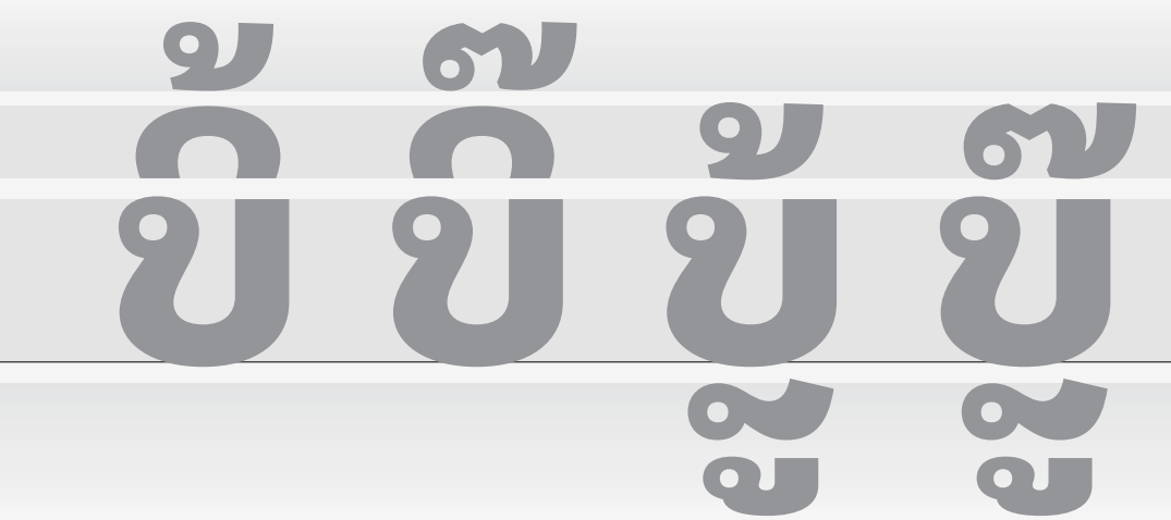
UI Fonts for limited vertical sapce